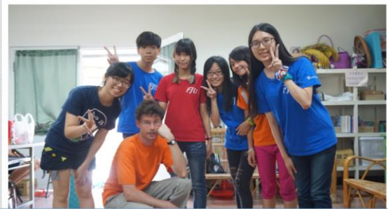
用生命陪伴生命，以生活教導生活