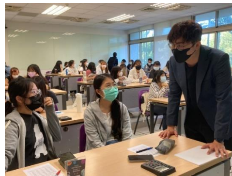
月培訓（一）溝通與情緒：勉勵大學伴在線上伴讀過程中，抱持理解去面對不同特質的價值觀，練習鬆動觀念來不被分類、標籤化定義他人以進行討論。