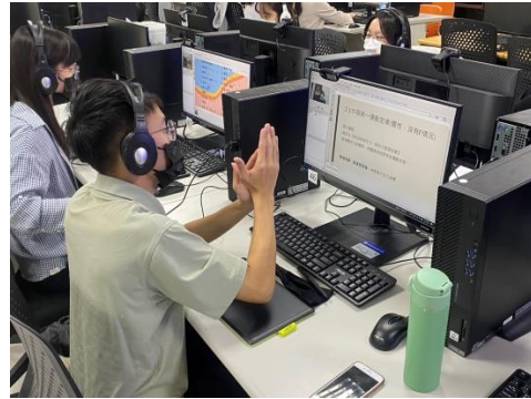
111-1 線上伴讀開課，螢幕兩端的大小學伴都很認真的彼此互動！