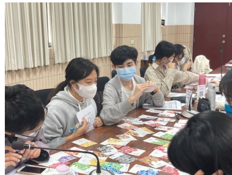
月培訓（二）青少年的關係建立與陪伴：勉勵大學伴打破刻板印象，認識自我生活風格特色以及不足來影響自己而不被侷限，探索適切的領域且發掘哪些內容可滿足自身需求。