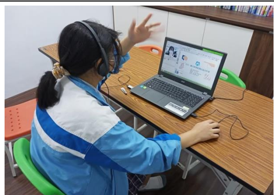
高雄華遠的小學伴課輔教室現場。