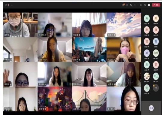
111-1 期初教育訓練受疫情影響改為線上進行。