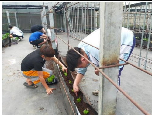
在悶熱的溫室裡，學童們種植的步驟也不馬虎，測距、挖洞，提供植物舒適的生長空間，讓他們更好的成長。