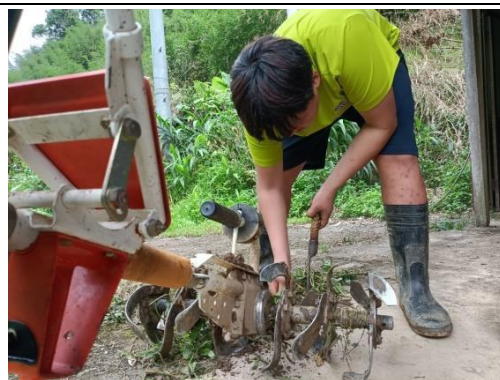
學童協助機具整理-使用刀具將鬆土過程中卡在中耕機上的雜草清除。