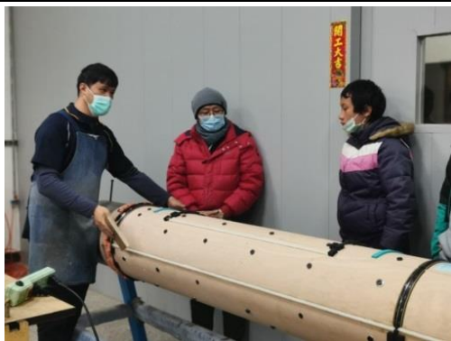
帶領學童參訪刀膜工廠，由廠長解說弧形刀膜製作機台的運作。