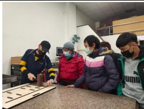
刀膜工廠的員工實際示範製作刀模的過程，一旁的學童眼神專注地凝視每一個步驟。