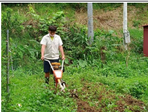
學童自主練習操作中耕機，因有使用經驗，上手快速，也會主動規劃動線。