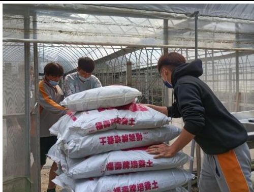
學童互相協助，平衡穩動推車，將教材搬進溫室。