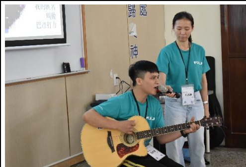
輔大偏鄉中心助理阿修為元大寶寶出身，將自身的成長故事編曲成音樂與學弟妹們期勉分享。