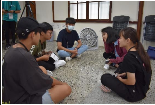
透過繽紛夏日盛典進行小組間的認識與共融。