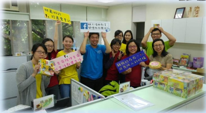
偏鄉教育中心團隊·把最好~給最需要的