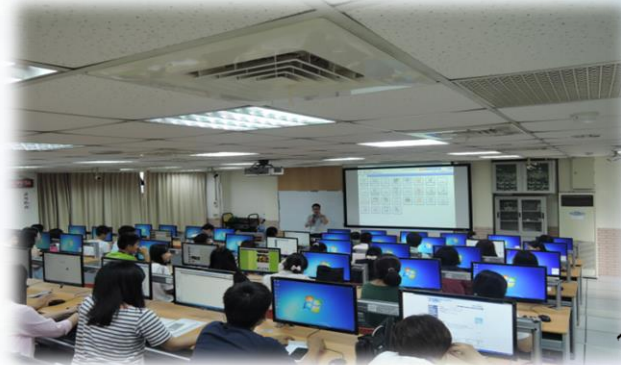
9/8學期夥伴大學助理、帶班老師工作坊