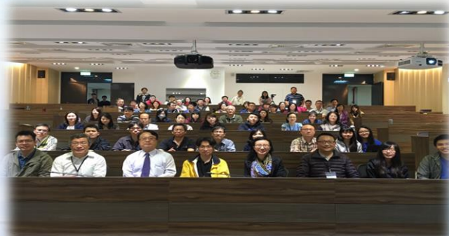
11/15程式設計教學導入數位學伴工作坊