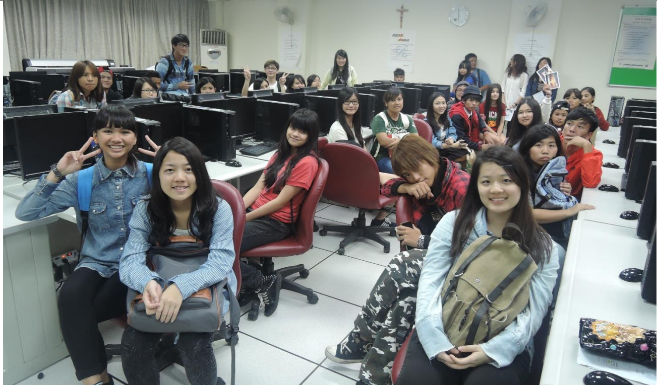
帶著小學伴至輔大課輔現場-電機系電腦教室，感受平日晚間遠方的大哥哥、大姊姊課輔氛圍，在離開輔大前，懷著感恩的心及喜悅留念合影。