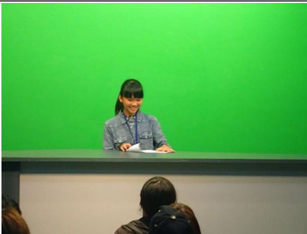
讓蘭嶼學生自願上台嘗試擔任主播的體驗，藉由抽新聞稿以其準備時間三分鐘，體驗主播反應能力與口條。