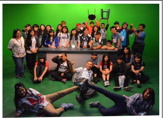
蘭嶼學生體驗主播樂趣後，大家一起在攝影棚內大合照，各個獨領風騷、展現魅力。