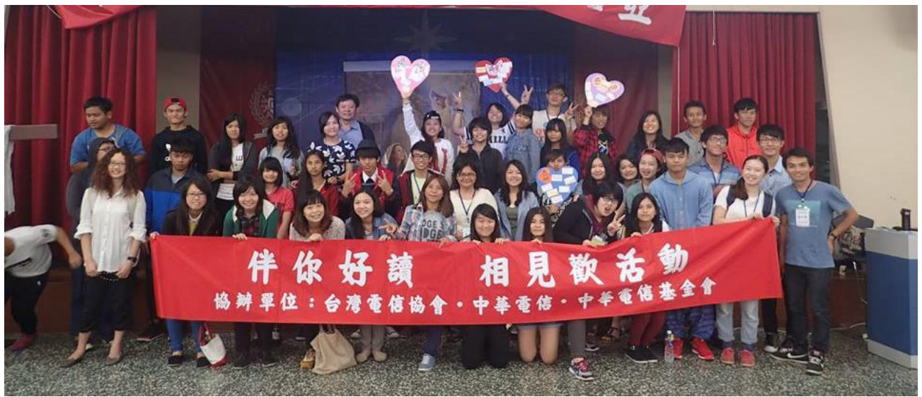
蘭嶼學生寫下感恩與祝福，“心心相印”在感謝版上，晚會結束後，所有參與人員一起合照，相見歡活動圓滿成功。