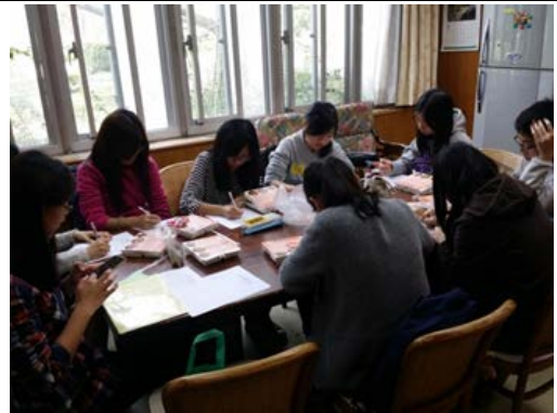
說明： 聖心小組聚會，於餐後填寫學習單。