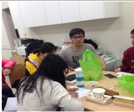
說明： 蘭嶼小組聚會，分科討論教學狀況彼此建議。