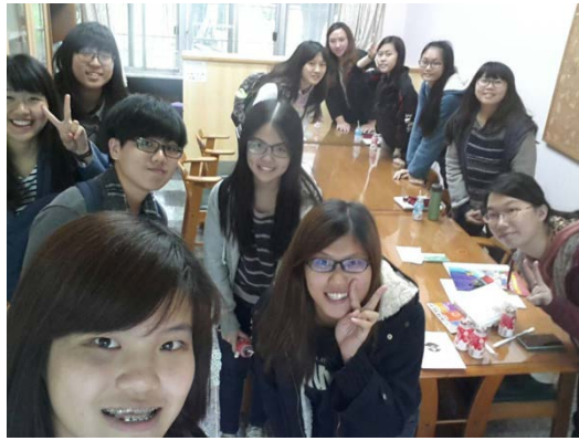
說明： 大愛小組聚會餐後開心的團拍。