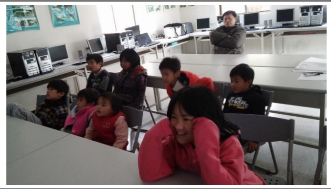
播放電影-冰雪奇緣，翁亨學童目不轉睛觀賞，並齊聲高唱電影中英文歌曲。