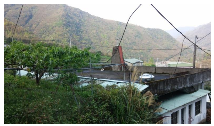
翁亨場地搬遷天主堂地點，右圖為天主堂上方景觀，電腦教室將加蓋於此。